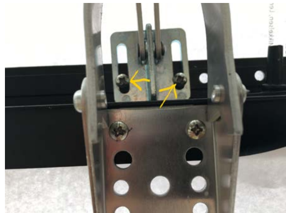
Foto 2: Anvend de to små forborede huller (ved de to gule pile). Beslaget spændes godt fast